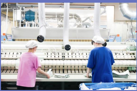
○ホテル向け・医療向けリネン