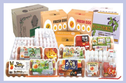
主力商品:鶏卵、鶏卵関連商品