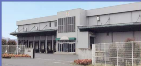
株式会社 ショウナン