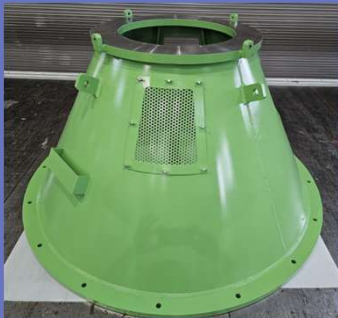
主力製品（大型ポンプ用部品）