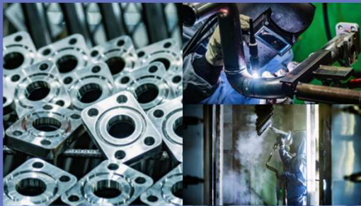
建設機械用油圧配管製造及びサブ組立