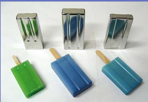
アイスのモールド型