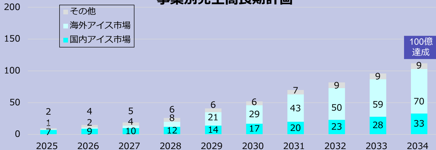
事業別売上高長期計画