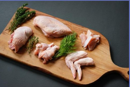
銘柄鶏 ありたどり