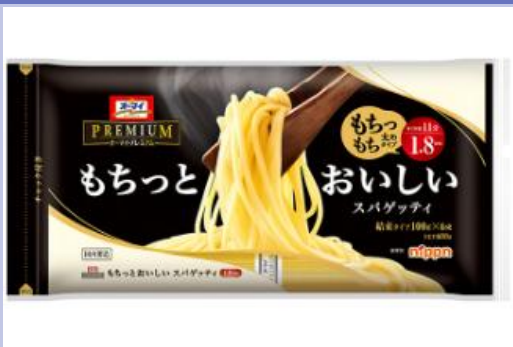
主力商品 パスタ類の食品