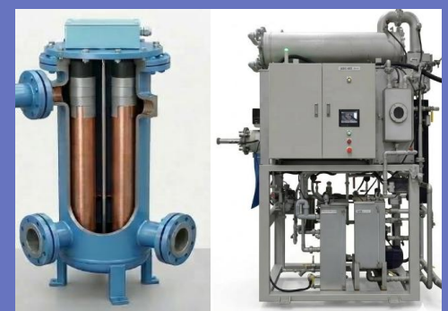
海洋生物付着防止装置/廃液処理装置

社内の開発・営業体制を強化するとともに、造船所やエンジンメーカー等のパートナー企業との連携を進めます。 また、ASEAN/欧州市場では現地パートナーを活用した販売・サービス体制を構築し、国内外で安定した事業展開ができる体制を整備していきます。