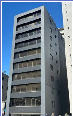
新本社ビル【PARTNERS Bldg】 (令和7年12月完成)