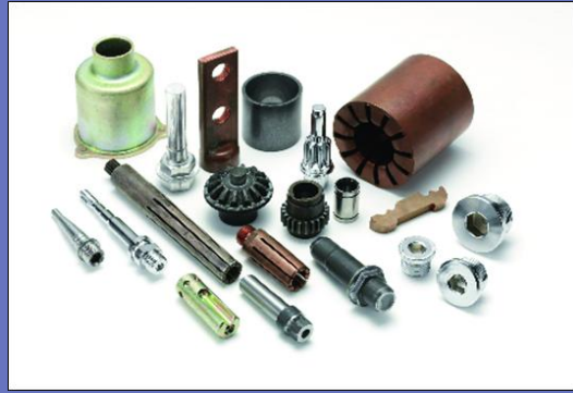
生産部品 (自動車、自転車、建築、電力)