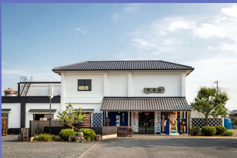
明利酒類株式会社の直売所