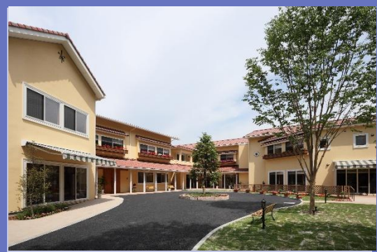
サービス付高齢者向け住宅 「ありがとうグラスias」