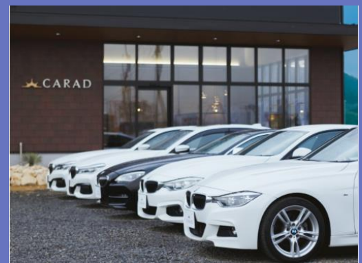
本社事業所及び販売車両