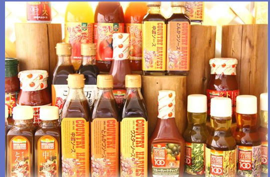
弊社液体調味料製品