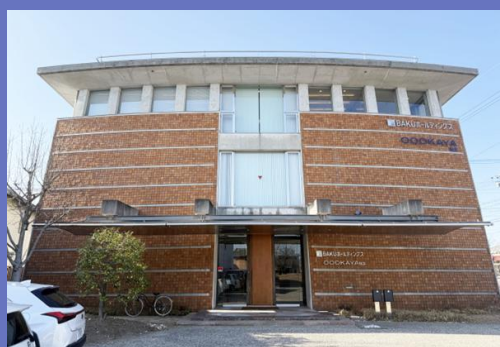
BAKUホールディングス本社ビル