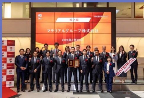
東京証券取引所 グロース市場 上場