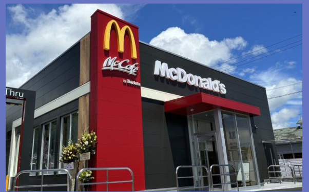
マクドナルドのフランチャイズとして 高知県の12店舗を担当