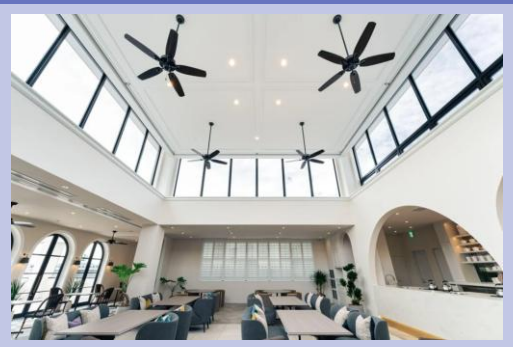
弊社飲食店舗の風景