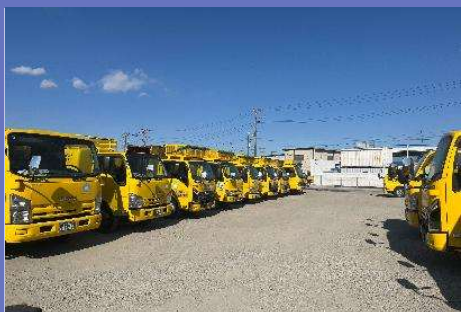
街を明るく照らすパッカー車