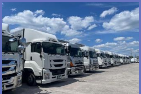
(配送用大型トラック)