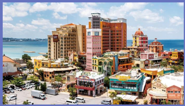
アメリカンビレッジ・デポアイランド