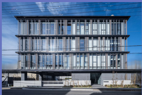
株式会社 大辰 本社事務所