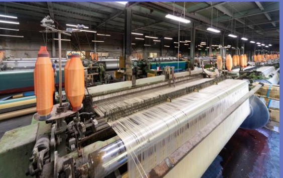
基布製造設備（織機）