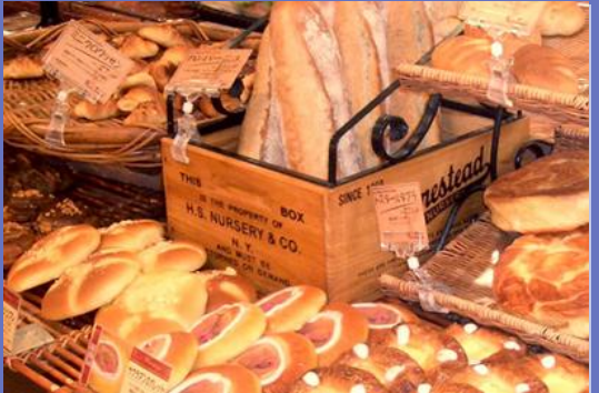
主力商品 欧風焼きたてパン