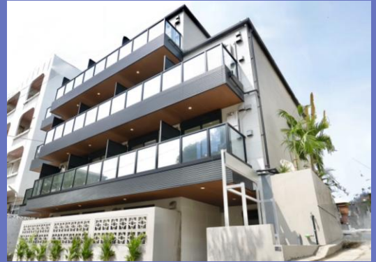
当社不動産ブランド グランデコートシリーズ