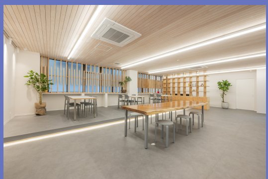
島田組本社 コミュニティスペース