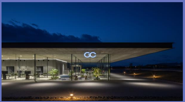
GC北大村店（エイコー商事新店舗）