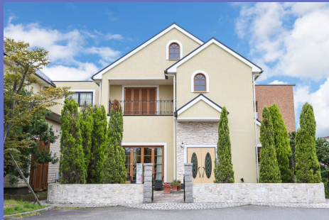
メモリアルハウスけやきの森