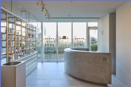
旗艦店舗 uka東京ミッドタウン六本木