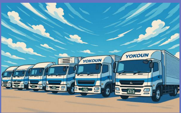
主力業務 物流サービス事業