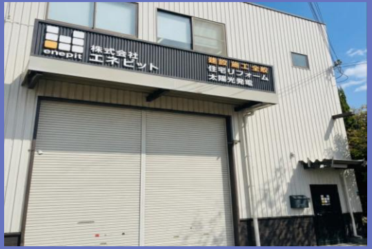
株式会社 エネピット本社