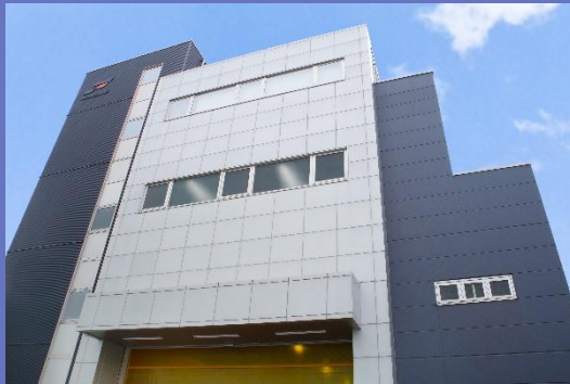
株式会社フジムラ製作所 本社外観