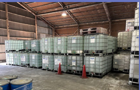
主力商品：ディーゼル車から排出されるNo x を浄化する尿素水