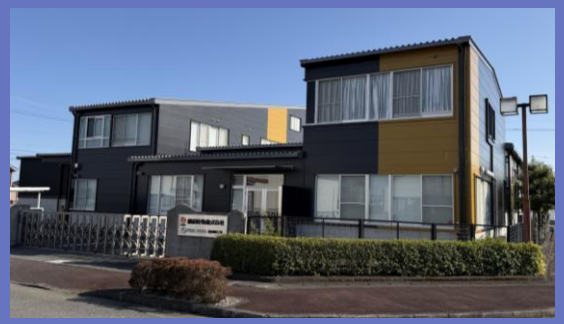
藤和乾物株式会社