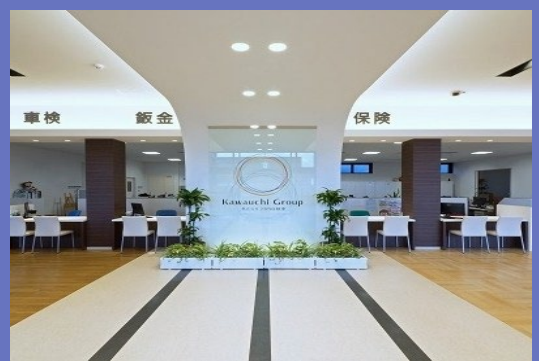
本社エントランス