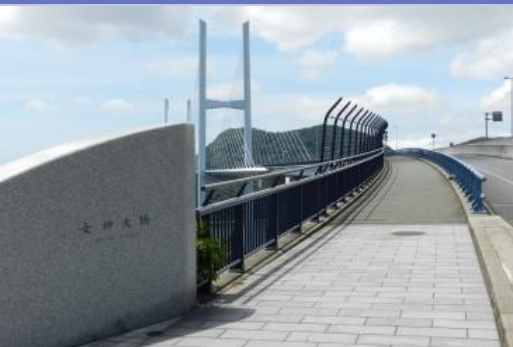
主力品目 溶融亜鉛メッキ・粉体塗装