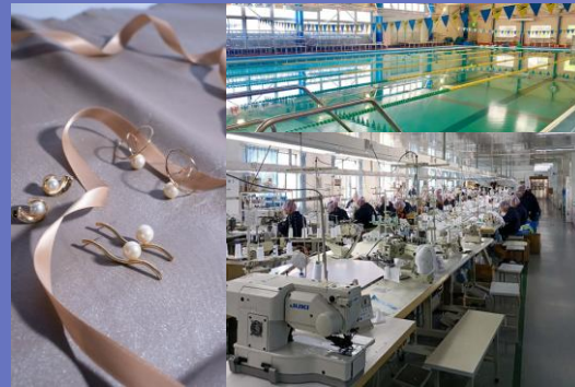
グループ各社の拠点、製品