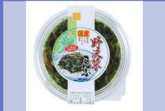
主力商品 野沢菜こんぶ

上進漬物工業は、おいしさ・たのしさ・健康を大切にした製品を通じ、笑顔あふれる食卓の創造を目指します。常にお客様本位の姿勢で、支持される製品・サービス・品質の提供を行うための挑戦を進めてまいります。漬物を通じて、日本の農業を持続可能なものにするためにも、生産者・従業員・関係する全ての皆様を大切に、栽培や加工方法・職場環境の改善に投資していくことで、ビジョン達成のため成長してまいります。