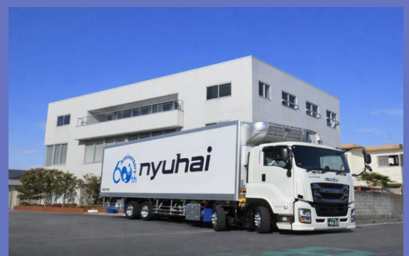
茨城乳配(株) 本社営業所