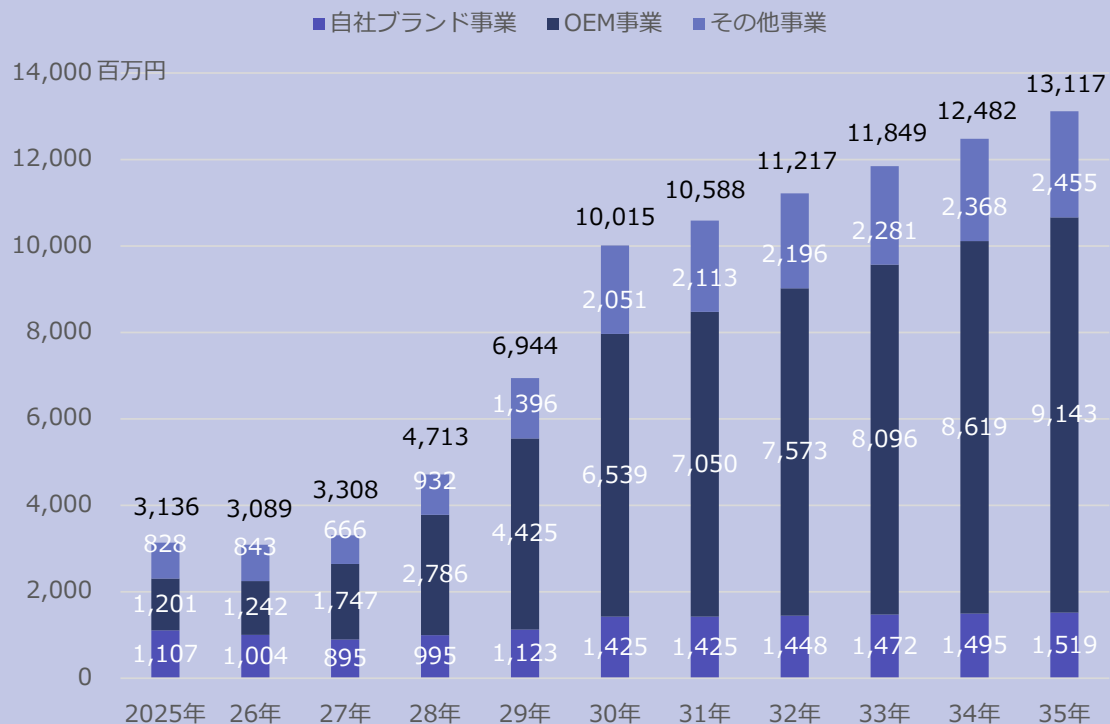
実現目標（事業別売上高）