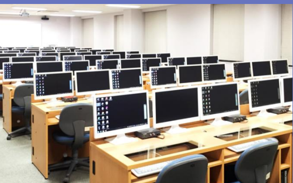
小中学校等のICT環境の整備に貢献