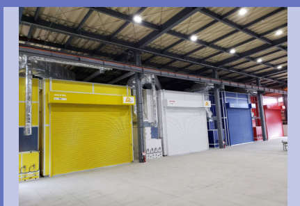
代表的商品 大型車輛用塗装ブース