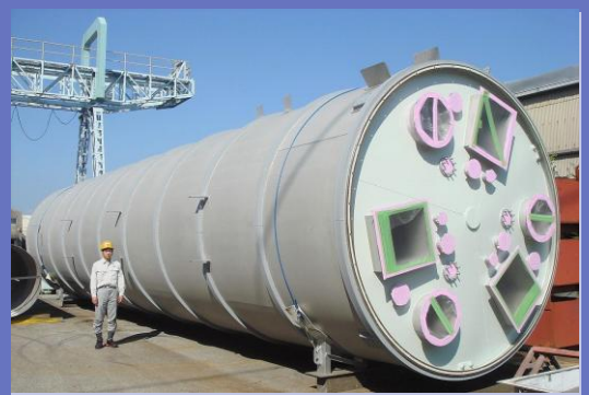
主力商品 大型製缶製品