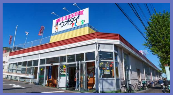
ウオダイプラス 鹿山店