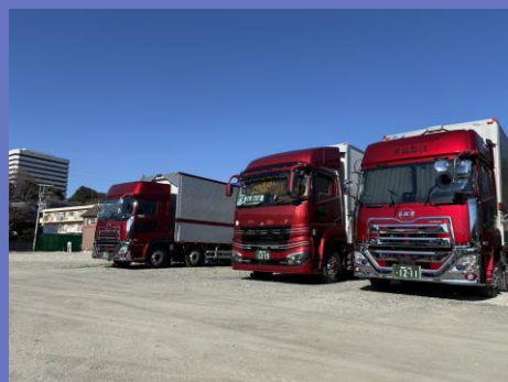
主力事業：一般貨物運送事業用トラック