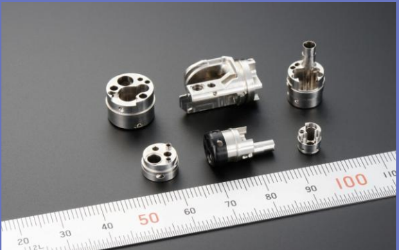
主力製品 医療機器部品