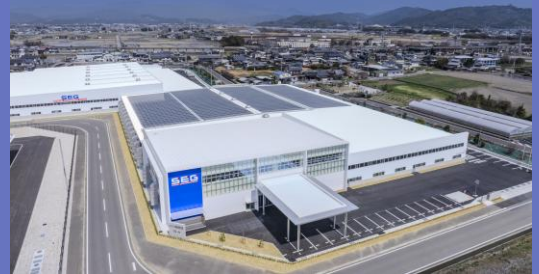
本社日章工場（2025年3月竣工）