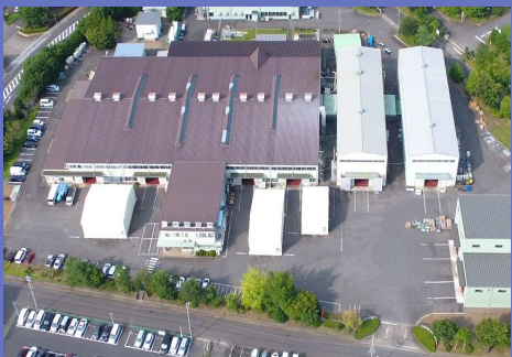
本社工場（茨城県つくば市）