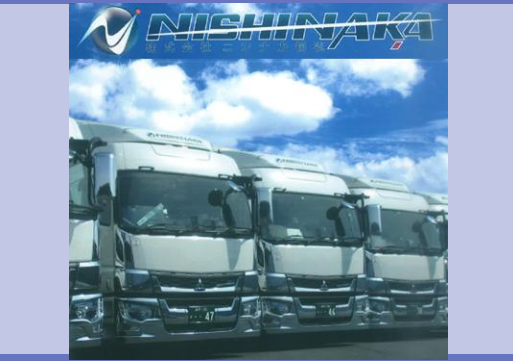
三菱ふそうのスーパーグレート